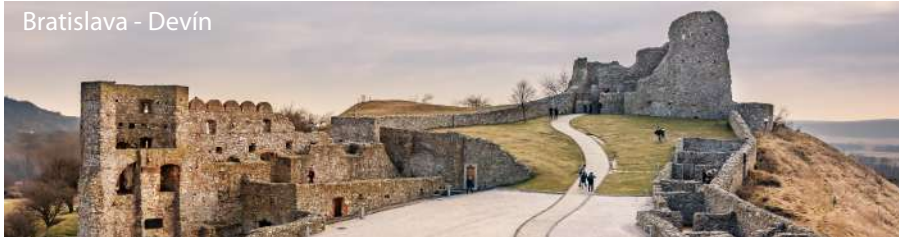
Bratislava - Devín