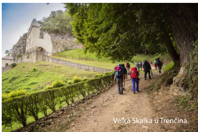
Velká Skalka u Trenčína